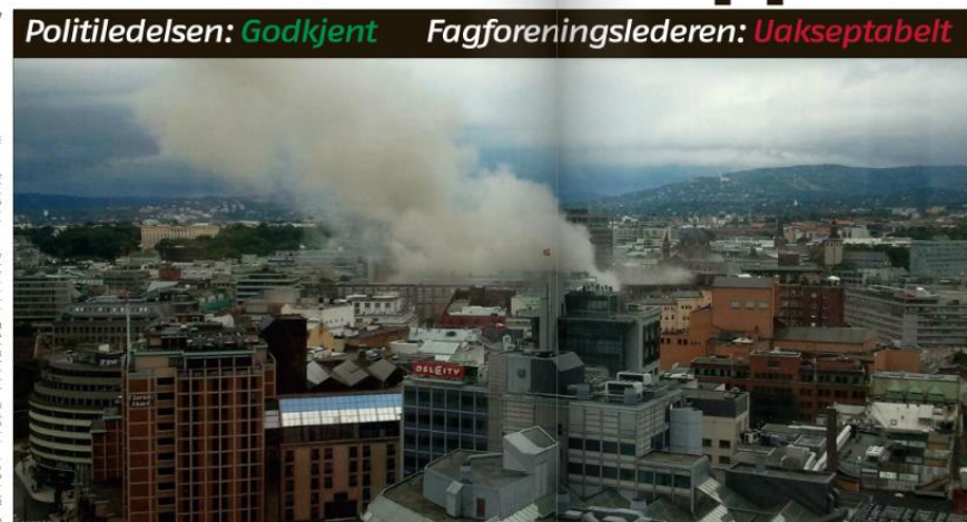
BEREDSKAP. De ti kraftige terrorbombene gikk av i Regjeringskvartalet i Oslo 22. juli i fjor, så ikke ledelsen i Romerike politidistrikt nødvendigheten av å gjøre det så raskt som mulig, men en mer gradvis utvikling etter hvert som vi får mer sikkerhet og beredskapsordning i Romerike politidistrikt.

Sikkerhet og beredskapsordning Sikkerhet og beredskapsordning som er i timer med å rykke ut når beredskapsordning er i full beredskaps- ordning på Romerike.