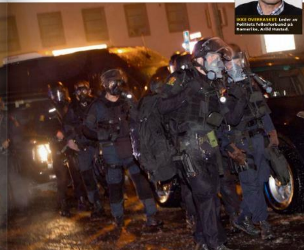
Øvelse 2012. Øvelse TYR i Romerike politidistrikt. Den avslørte grovnevnte mangler, følge en ny rapport. Dette bildet viser øvelsen ved URV i stabchef Holmstrøm og ledelsen på på muligheten for å trene stor

«Feri plassering av stab: «RFD etablerte stab i lokaler på Gardermoen politistasjon, mens