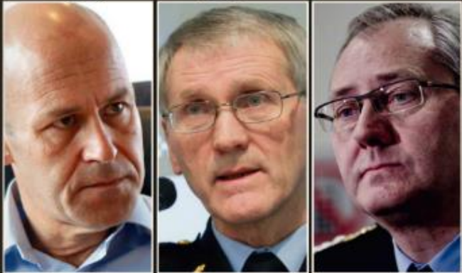
BLE VARSLET: I mars ble fungerende politidirektør Vidar Røvik varslet om at to av politimester Jaagen L. Håkdaals næraste medarbeidere tok seg mobbet av sjelen. Ytterligere to politidirektører, Øystein Møllend (t.v.) og Odd Reidar Høimlegård (t.h.), ble også varslet. Likvelv kjendte det ikke noe for og ut i tre polititopp på Romerike varslet at han ble syk av politimesteren. SIDE 3 OG 7