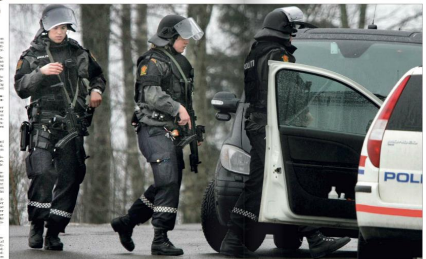
IKAL LEVEL: Politidirektoratet (PDI) har ingen oversikt over hvor mye de ulike politidistriktene trener på kriselandsforing. Det finnes ingen krav om hva det skal være på, eller hvor mye det skal være. Det er derfor ingen sammenheng at det er dekket for en øvelse på Røaverde som kort tid i løpet av oktober er det vanligvis dekket for der. Trossgjennomføringsansvarlig (PDI), Sids-Jens, i et samarbeid med Romerikes Blad.

SAKENS GANG Romerikes Blad TIPS OSS Hvis du har tips eller informasjon om saker som kan være av interesse for leserne, kan du kontakte oss på telefonnummer 22 10 10 10 eller via e-post til tips@romerikesblad.no