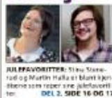
JUL PRAVORITTEK: Silje Skarvud og Martin Halle er blant kjendisene som reiser i sine juleferier. DEL 2, SIDE 16 OG 17