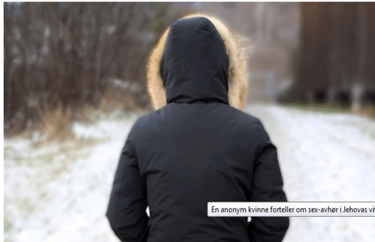
En anonym kvinne forteller om sex-avhør i Jehovas vitner

En anonym kvinne forteller om sexavhør i Jehovas vitner. – Det var en fæl situasjon, sier hun.